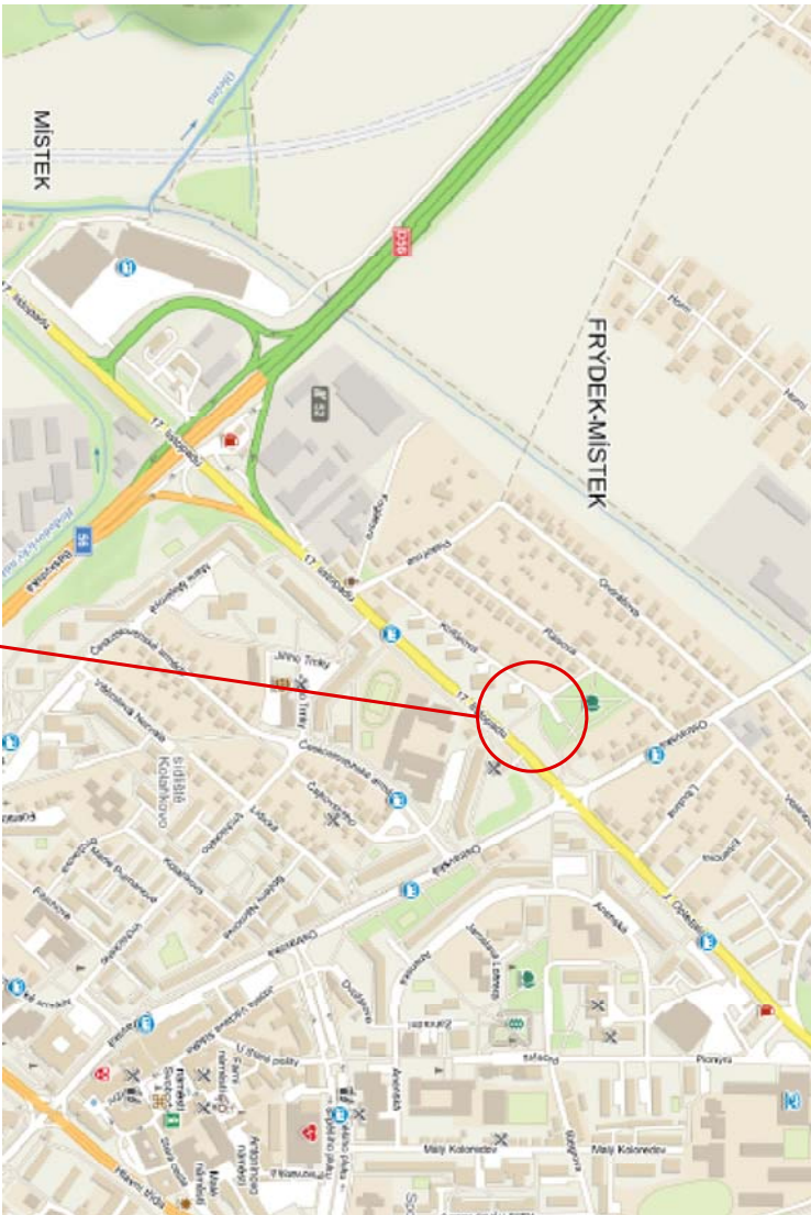
ZÁJMOVÁ OBLAST - FRÝDEK-MÍSTEK